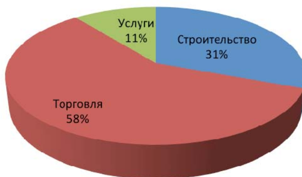
Рисунок 2 – Малое и среднее предпринимательство в ЕС, 2012 г. [13]

Наиболее популярные направления деятельности для МСП в Евросоюзе представлены на рисунке 2.